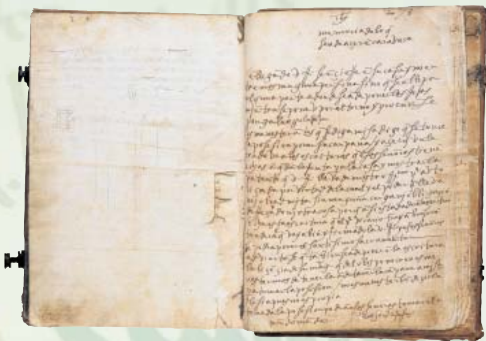
Carta autógrafa de Santa Teresa de Jesús

vas transcripciones de los privilegios y otros documentos antiguos. En esta ocasión la labor se encargó a un profundo conocedor de la historia local, Agustín Marín de Espinosa 10 , quien concluyó su trabajo a principios de abril de 1856 11 , siendo retribuido con 460 reales por el mismo. Entre las transcripciones que realizó figura la Confirmación de Privilegios a la villa de Caravaca por Carlos I, fechada en Valladolid el 7 de agosto de 1523, original actualmente desaparecido. Estas transcripciones se conservan insertas en el Libro de Actas Capitulares del Ayuntamiento de Caravaca correspondiente a los años 1855 a 1857 12 . Al año siguiente, 13 se encargó nuevamente a Agustín Marín de