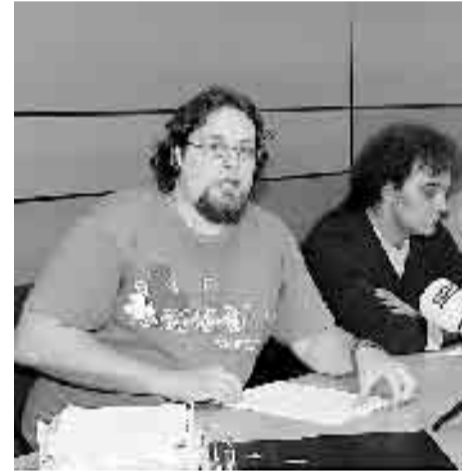
FIRMES. Miembros de la Plataforma,

Otras de las irregularidades que señalan es la falsedad en la direc-