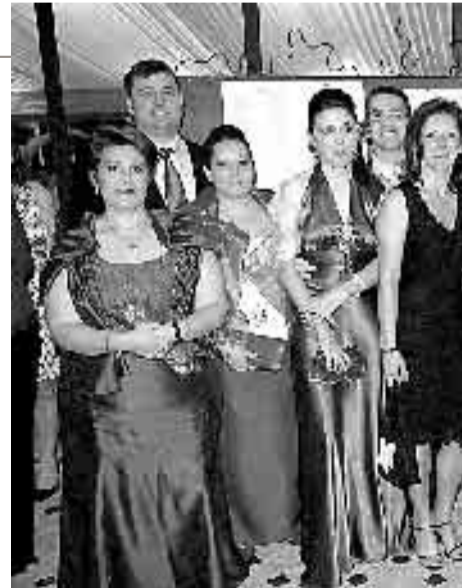
CENA. Miembros y amigos de CHUBB,

A lo largo de estas dos horas se realizarán actividades de animación, exhibición de zancos y de cuerda floja, malabares, pelotas, diábolos, palos chinos, mazos, con la participación de los asistentes. También se hará entrega de premios de los concursos de cuentos cortos y separadores de